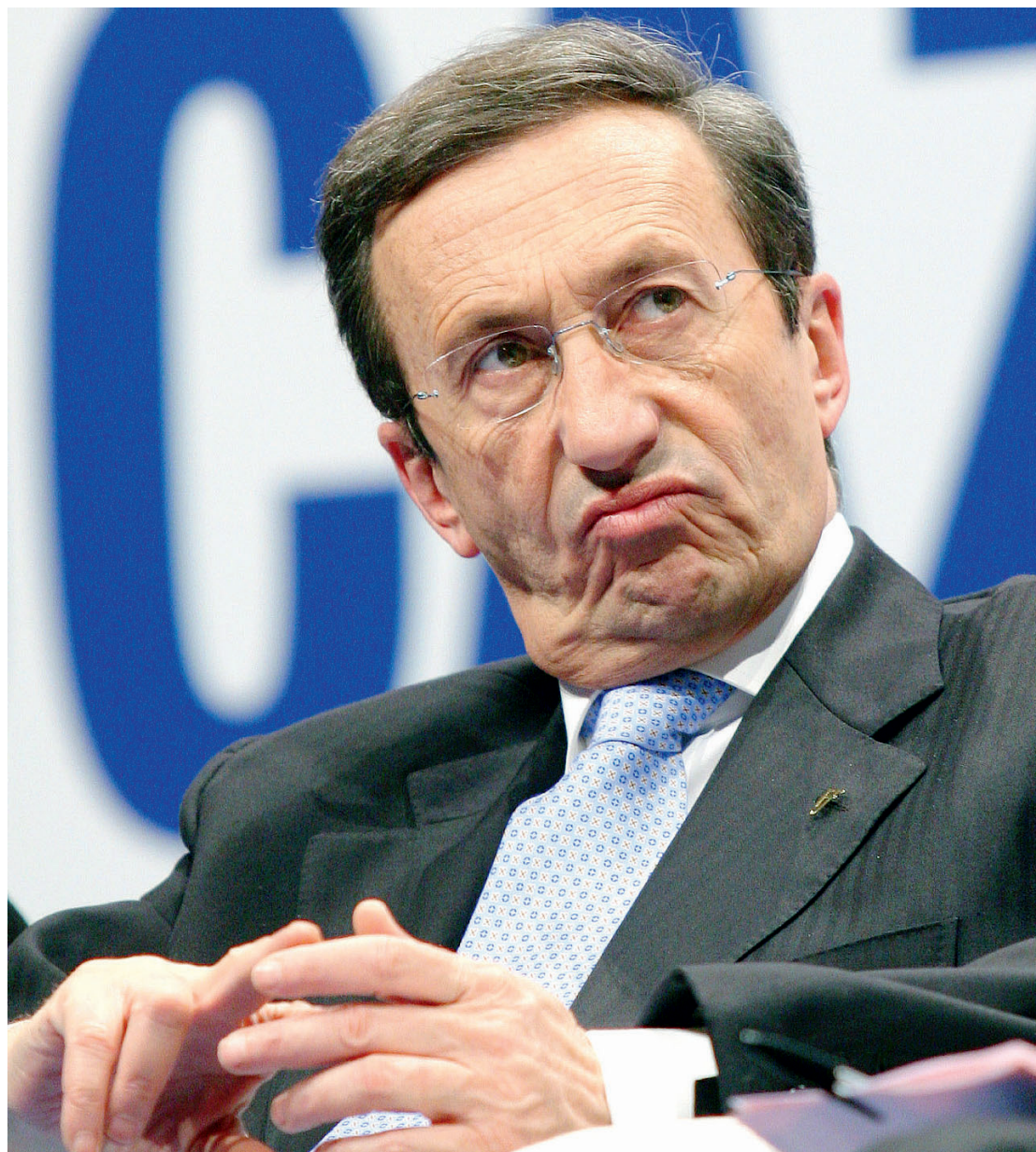
IL PRESIDENTE della Camera Gianfranco Fini