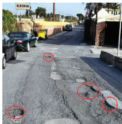
BUCHE in via Michelangelo

La manutenzione delle strade e la viabilità sono spie di controllo per il cittadino per verificare il buon governo della città e soprattutto se la prevenzione di incidenti e infortuni stia a cuore o meno, dei nostri amministratori pubblici. Ad Albenga, al confine con la città di Alassio, c'è un'emergenza senza precedenti che, fino ad oggi, è stata trascurata e disattesa. Emergenza che richiede un immediato e duplice intervento del Sindaco Antonello Tabbò insieme al Sindaco Marco Melgrati. Si tratta della strada di via Michelangelo. Una strada che costeggia il lungomare di Albenga, nel quartiere di Vadino, nel tratto compreso tra il passaggio a livello di via Tiziano e l'imbocco con la strada provinciale dell'Aurelia. Di competenza del Comune di Albenga proprio fino alla sede della Discoteca Essaouira, - confermano dall'Ufficio tecnico del Palazzo Civico ingauno - e più precisamente fino al Rio Colombara, dove è segnato il confine con la limitrofa «città del muretto». Ecco, è questa una strada completamente dissestata nel manto stradale. Buche, fessure, crepe, asfalto sconnesso e avvallamenti nascosti. Con notevoli proble-