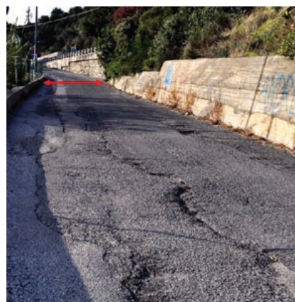
ASFALTO dissestato sulle vie della movida

problema di viabilità, essendo previsto un doppio senso di circolazione, di fatto impossibile per la ridotta ampiezza della carreggiata. Per mettere mano alla questione urgono immediati provvedimenti, concordati tra le due Amministrazioni. Albenga e Alassio qui, in Via Michelangelo, possono e dovrebbero collaborare. Per risolvere la problematica della strada, al di là del colore politico. Per far sì che i Comuni siano realmente vicini alle esigenze dei cittadini. In questo caso vicini ai giovani e alle loro tasche, talvolta modeste. Il fatto che, ad ogni week-end, qualche malcapitato, percorrendo via Michelangelo, rischi un infortunio provocato da una caduta accidentale o un danno alla carrozzeria della propria autovettura, potrà anche incentivare le attività produttive dei Reparti ospedalieri di ortopedia o delle Officine meccaniche, ma certo grava non poco sulle spese del cittadino e della famiglia. Che fare allora in Via Michelangelo? Prima di tutto, occorre dichiarare la strada a senso unico, con un'ordinanza. Per far sì che le autovetture parcheggiate non vengano più danneggiate e i pedoni possano usufruire di un ideale